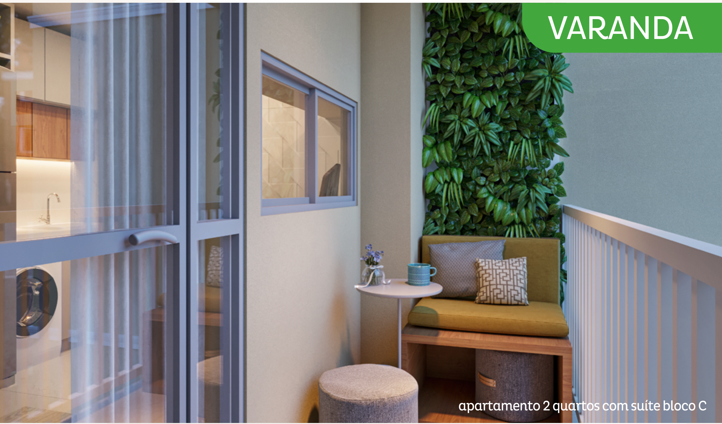
apartamento 2 quartos com suíte bloco C