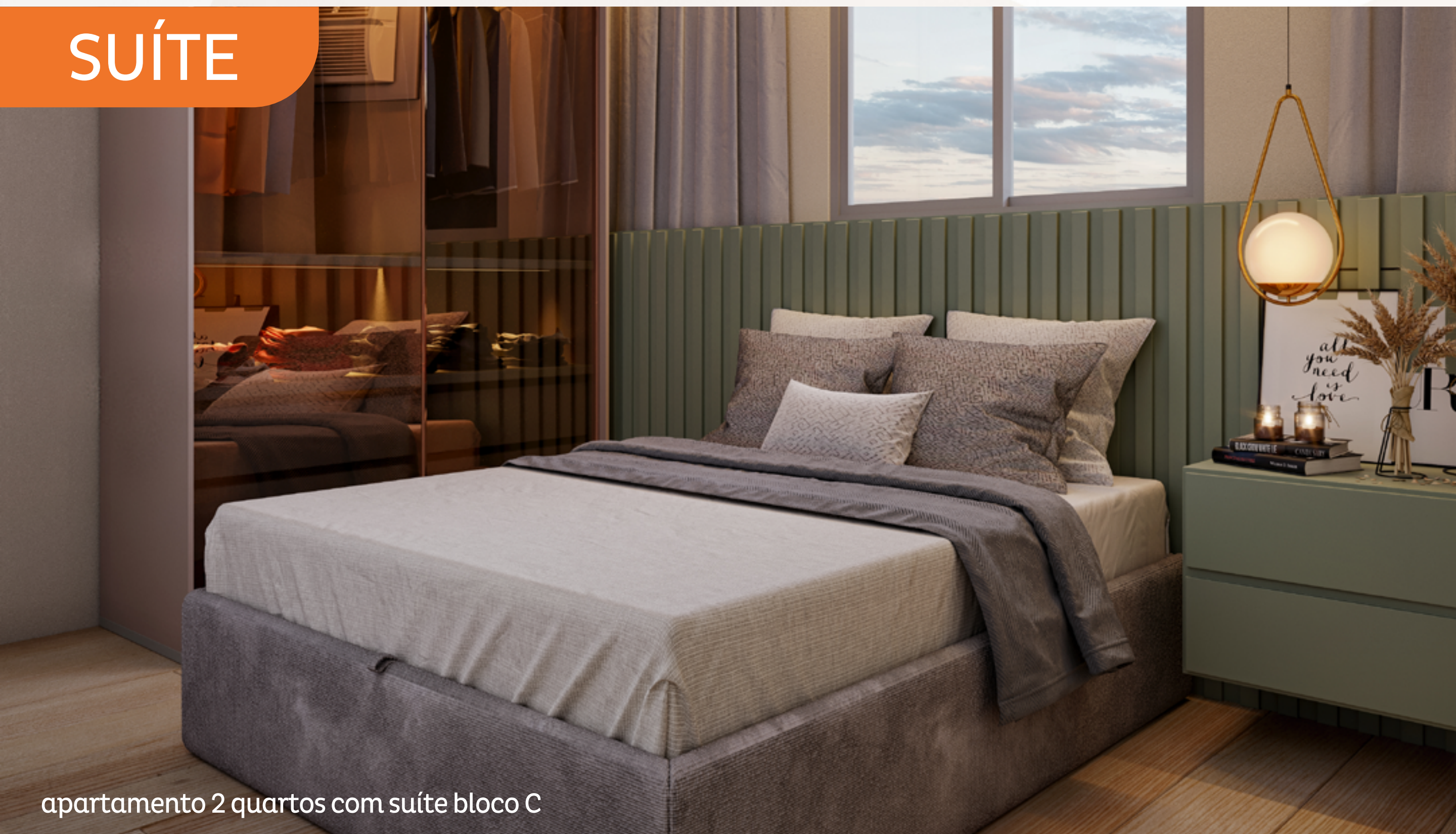
apartamento 2 quartos com suíte bloco C