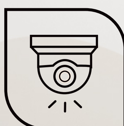
Câmeras de Segurança