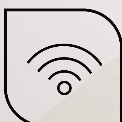
Preparação para Wi-fi nas áreas comuns