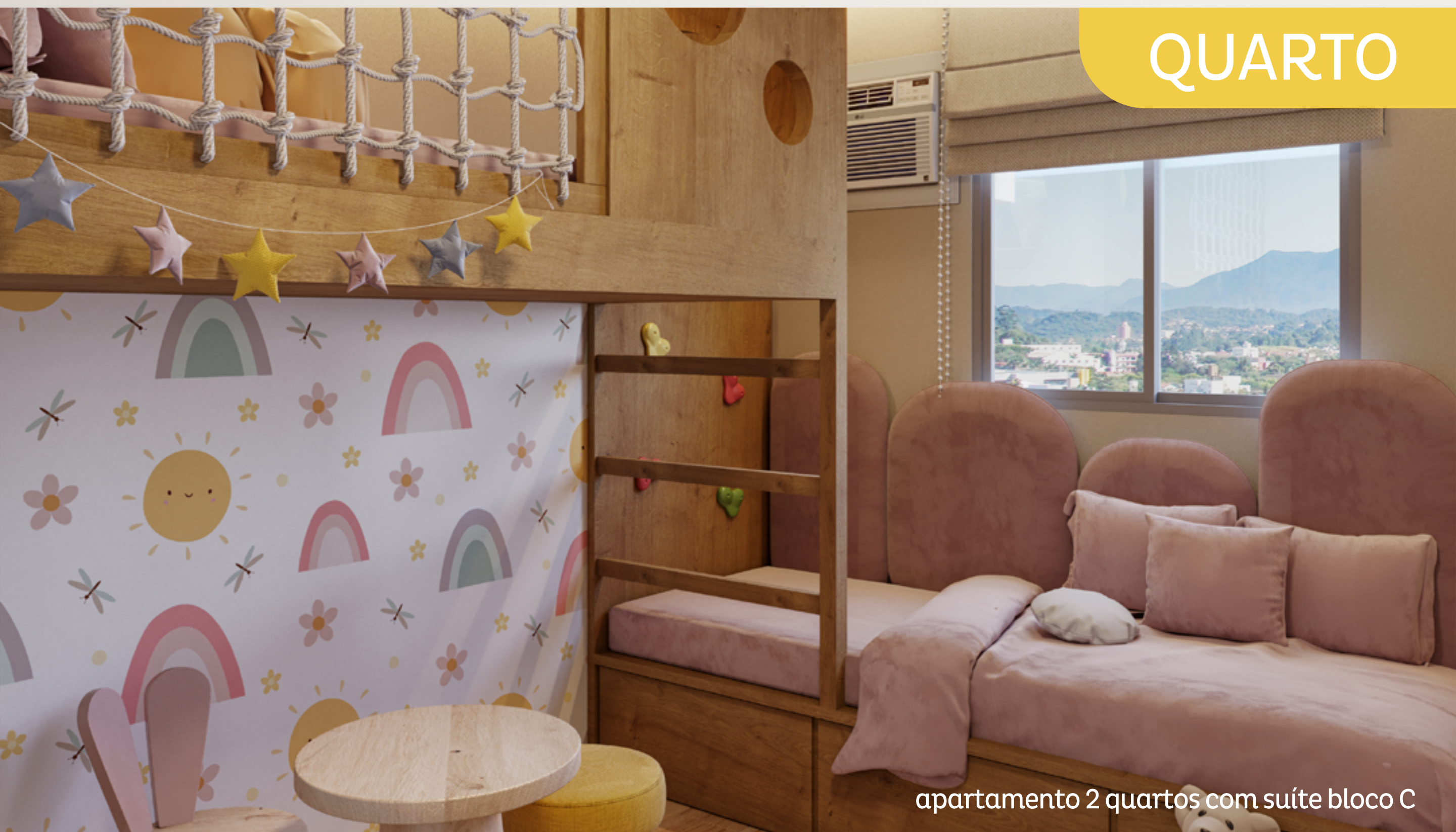
apartamento 2 quartos com suíte bloco C