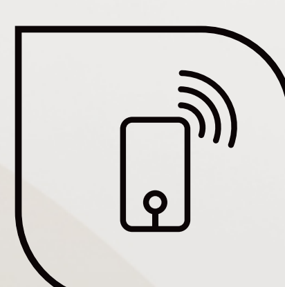
Alarme com sensor de presença